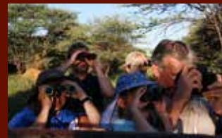
AUSZEIT VOM ALLTAG