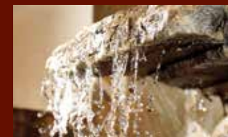
ATTENTIVE TO DETAIL