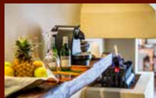
4 STARS COMFORT