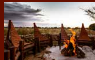
PRIVATE YET FAMILIAR