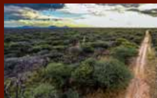
KAMBAKU GAME RESERVE